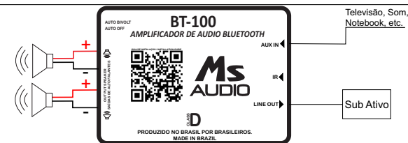
Figura 1: Esquema de ligação - BT 100